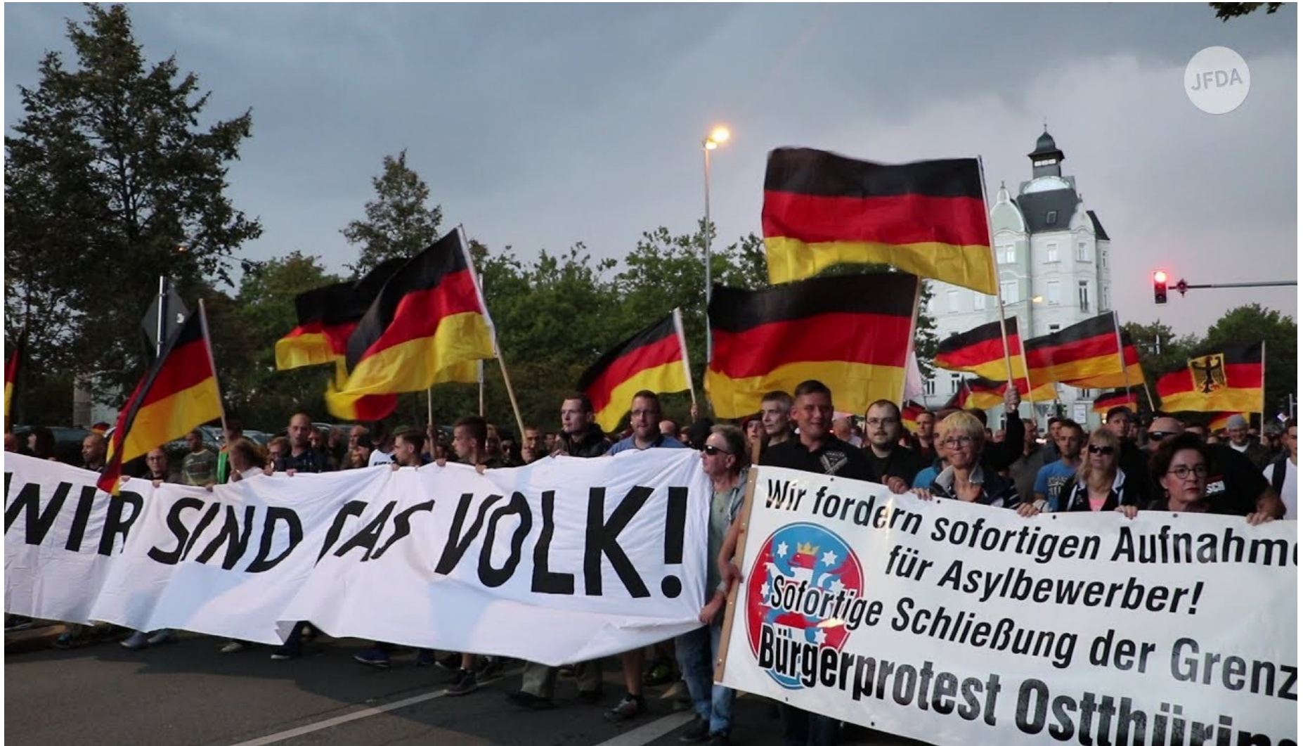
Pro Chemnitz Demonstration

( https://www.youtube.com/watch?v=7HQ1c9s8Pfl )