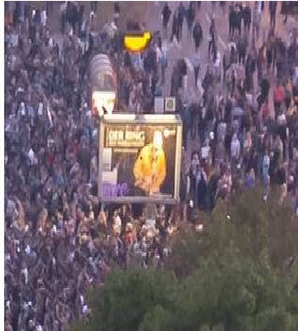
Luftaufnahmen der Pro Chemnitz Demo

https://www.stern.de/politik/deutschland/chemnitz--es-spricht-alles-dafuer--dass-das-jagdszenen-video-echt-ist-8347072.html