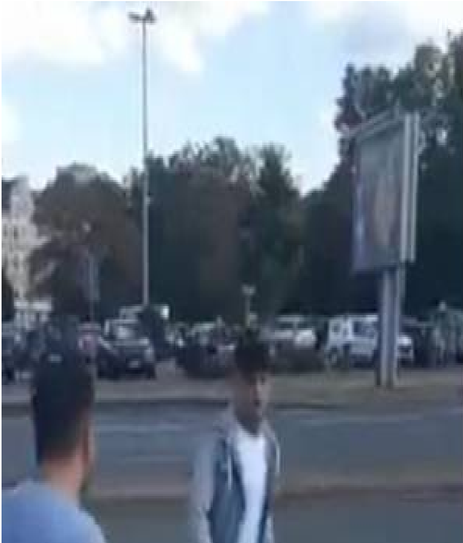
Amateurvideo von Antifa Zeckenbiss